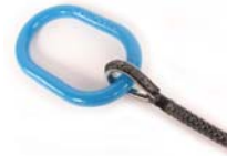
Anneau (1 lanière)