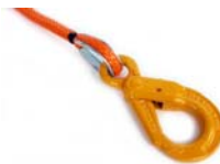
Crochets autobloquants (3 lanières)