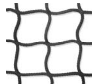
Filet sans nœuds en nylon